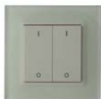
Bouton Poussoir RADIO 2 ZONES Réf : SV90009

Brancher l'entrée 230V du convertisseur sur le récepteur radio.